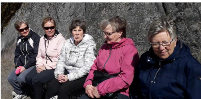
<- Unelmien liikuntapäivä 10.5.2022 Fjällbon rannassa

28.2.2022 kirjasto, Kevätkokous, osall. 12 28.3.2022 kirjasto, osall. 12 25.4.2022 Hyrsylän Mutka, osall. 11 10.5.2022 Fjällbo, osall. 6